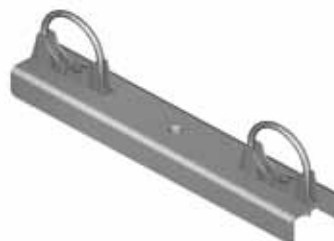
TA 8006 SUPPORTO PER STATIVO s. 25 Portata 150 kg Peso 0,80 kg