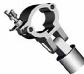
AL 8909 COLLEGAMENTO A FARFALLA SNODATO Peso 0,66 kg