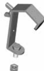
TA 8902 GANCIO A "G" IN ACCIAIO ZINCATO CON MOLLA Portata 40 kg Peso 0,29 kg