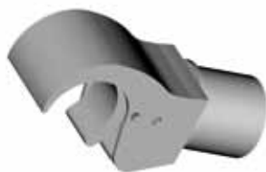
AL 8905 GANCIO A MOLLA Peso 0,39 kg