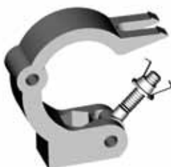
AL 8911 COLLEGAMENTO A FARFALLA L = 30 mm Portata 750 kg Peso 0,36 kg