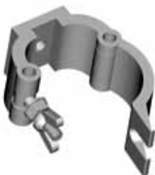
AL 8910 COLLEGAMENTO A FARFALLA L = 50 mm Portata 500 kg Peso 0,36 kg